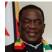
ЭММЕРСОН ДАМБУДЗО МНАНГАГВА

Президент Алжирской Народной Демократической Республики