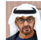
МУХАММЕД БЕН ЗАИД АЛЬ НАХАЙЯН

Президент Объединённых Арабских Эмиратов